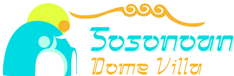
GAMBAR 1 LOGO PERUSAHAAN SOSONOAN DOME VILLA

Penulis dalam rencana bisnis ini akan memberi nama ” Sosonoan Dome Villa” pada bisnis akomodasi ini . Sosonoan yang berasal dari kata sono dalam Bahasa Sunda yang artinya “rindu atau kangen” sehingga maksud kata sosonoan itu sendiri artinya melepas rindu sedangkan Dome villa pada nama bisnis ini merujuk pada jenis villa yang dimaksud yaitu berupa dome.