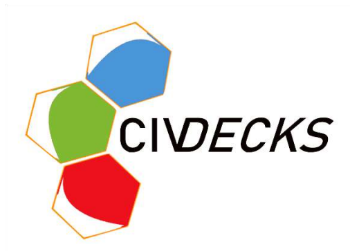
Gambar 1. 1 Logo Civdecks