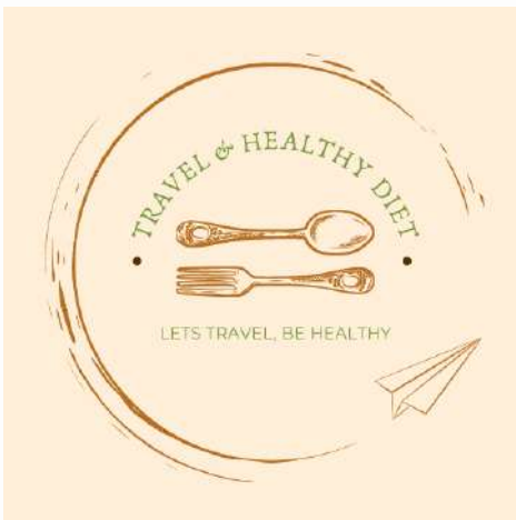
Gambar 1.1 Logo Travel&Healthy Diet