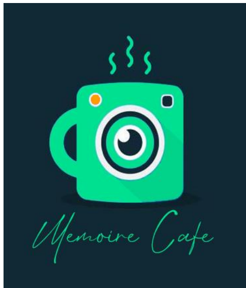
GAMBAR 1 MEMOIRE CAFÉ

Pembuatan logo usaha bisa melalui tulisan, gambar, atau sketsa yang bisa menggambarkan usaha tersebut dengan jelas. Logo usaha tidak harus rumit tetapi sama seperti nama, logo diharapkan bisa menjelaskan identitas dari usaha itu sendiri. Berikut ini ialah logo yang dirancang oleh penulis terkait pembuatan logo :