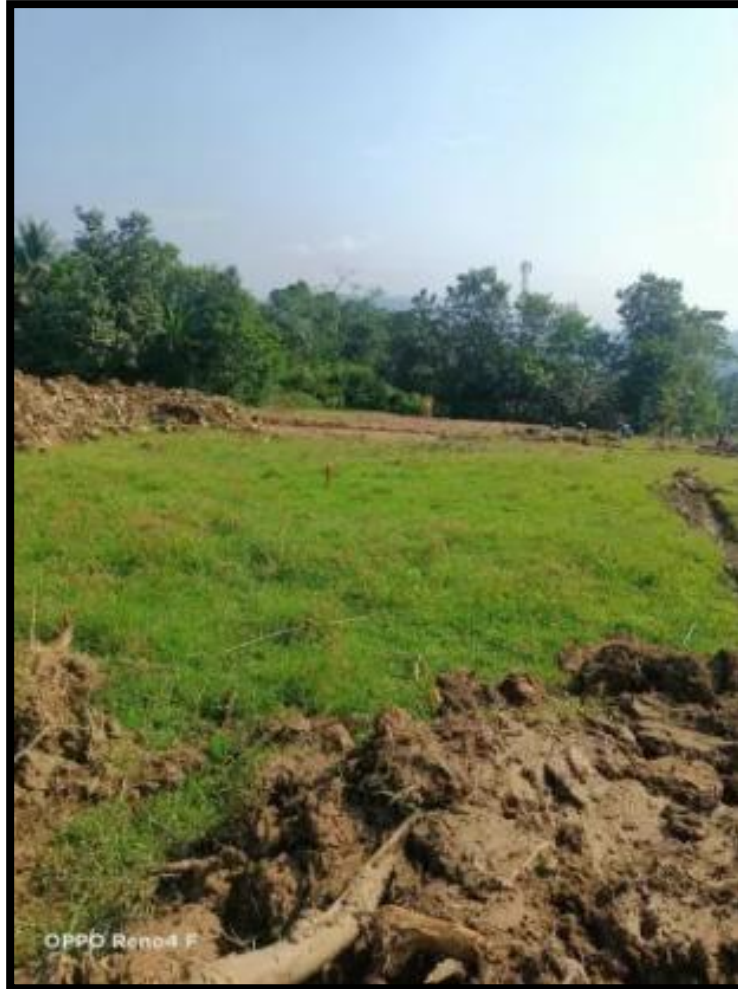
Gambar 3 Lokasi Usaha NB Butler