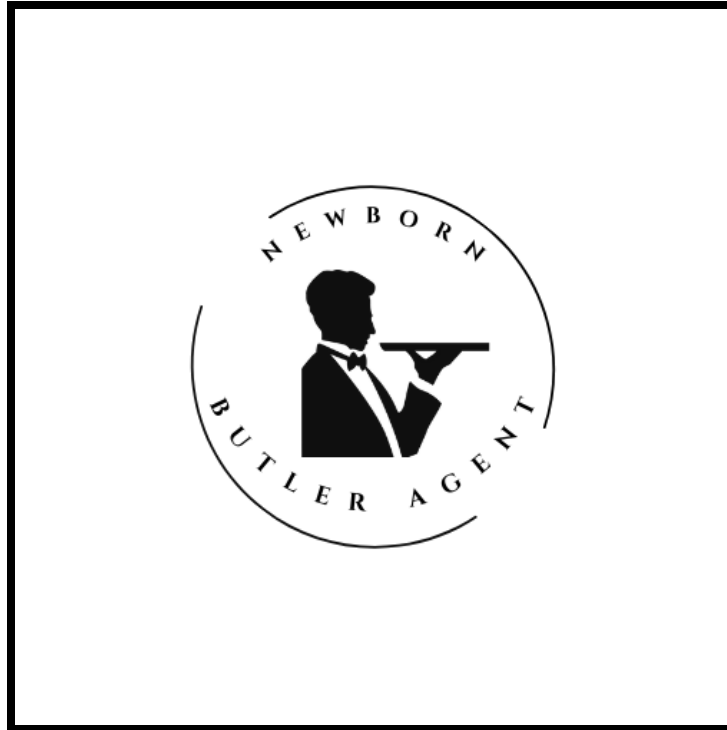
Gambar 1 Logo Newborn Butler Agent