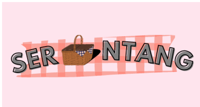
Gambar 1. 1 Logo Serantang

Logo dari Serantang menggambarkan sebuah set up piknik dengan sebuah rantang, dimana pada latar ada sebuah alas/karpet kotak kotak berwarna merah muda yang cantik, tujuannya agar menarik minat pengunjung dan menggambarkan sebuah piknik.