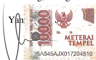
Dwi Putri Nuraini