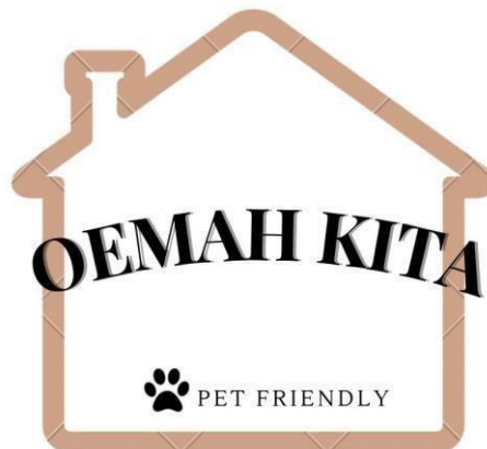
GAMBAR 1.1 LOGO DAN NAMA

Logo adalah sebuah simbol yang memiliki elemen gambar dan identitas secara visual, Menurut Rustan (2013) , logo merupakan bagian kata dari logotypes, logo secara sederhana dapat diartikan sebagai gambar atau teks dengan makna tertentu. Istilah logo pertama kali muncul pada tahun 1937, dan saat ini istilah logo lebih populer daripada logotypes. Logo dapat menggunakan elemen apapun baik berupa teks, gambar, logogram, gambar maupun ilustrasi. Logo juga menjadi identitas utama dan tentunya dimaksudkan untuk memperkenalkan perusahaan kepada calon konsumen. Perihal nama yang dipilih untuk bisnis ini yaitu ‘ Oemah Kita ’ nama tersebut menurut penulis yang berarti Oemah yaitu tempat tinggal dan Kita yang berarti dapat dihuni oleh manusia dan hewan peliharaan yaitu kucing karena penulis ingin membuat bisnis kost yang ramah hewan peliharaan.