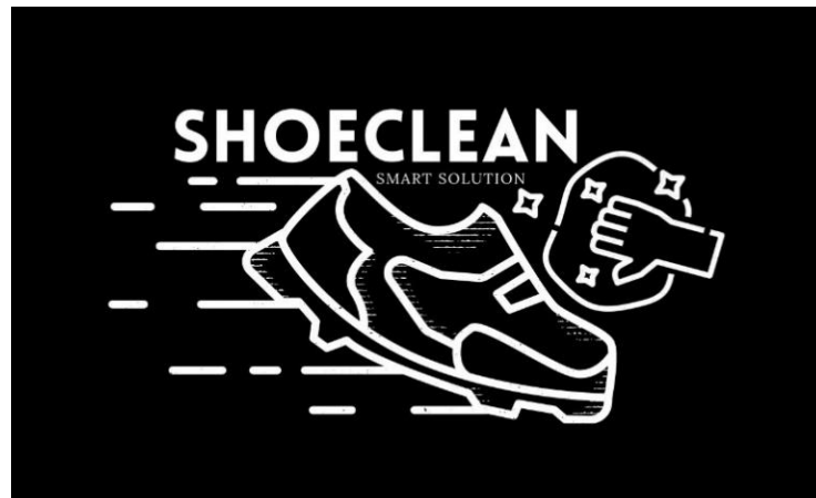
Gambar 1.1 Logo ShoeClean Smart Solution

yang dimiliki oleh perusahaan. Penjelasan dan makna yang terdapat pada logo diatas yaitu dapat diartikan sebagai berikut: