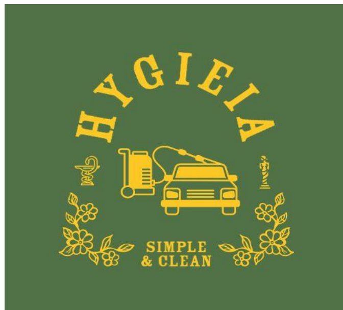
Gambar 1. 1 Logo Hygieia Car Wash