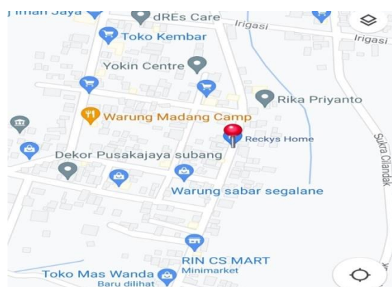
Gambar 2 Lokasi Bisnis