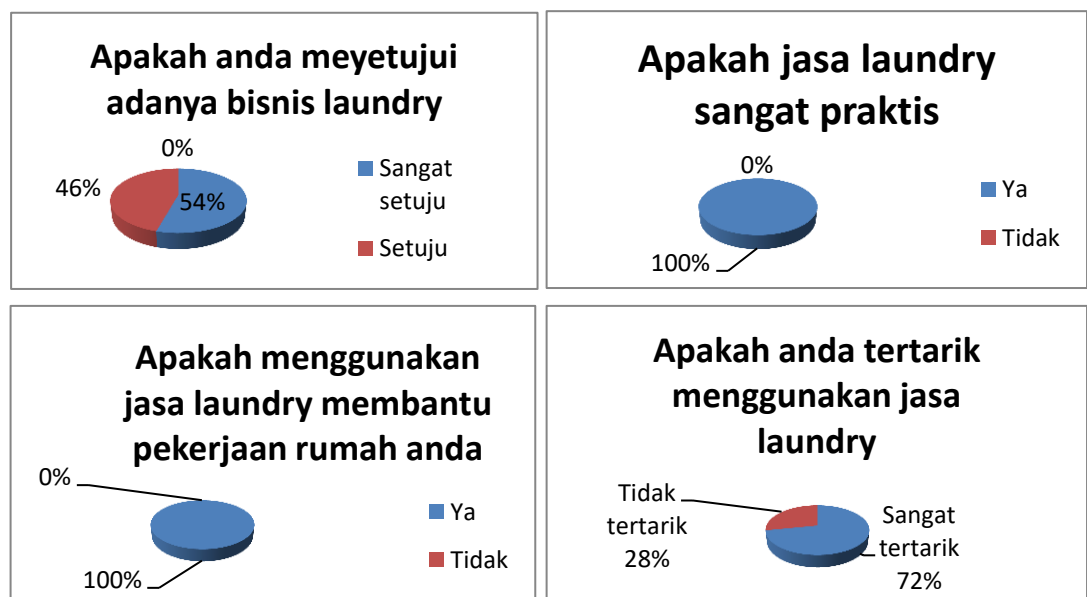
Table 2 Analisis Minat dan Keinginan

Berikut grafik mengenai minat dari perencanaan bisnis di bidang jasa cuci/laundry yang sudah di analisis oleh penulis di Desa Rangdu, Kecamatan Pusakajaya, Kabupaten Subang. Berdasarkan survey yang di bagikan terhadap 100 orang mengenai perencanaan bisnis "Kangen Ngucek" laundry. Hasil survey sebagai berikut :