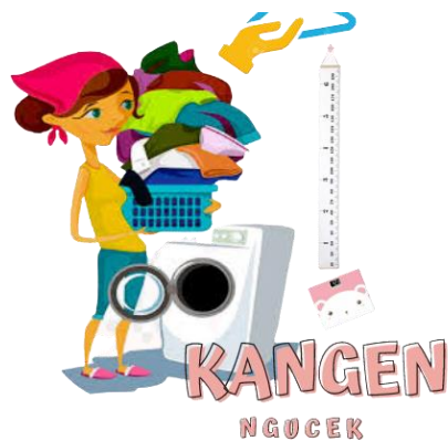
Gambar 1 Logo Bisnis

Menurut teori (David E, 2006) ‘Logo adalah identitas suatu perusahaan dalam bentuk visual yang di aplikasikan dalam berbagai sarana fasilitas dan kegiatan perusahaan sebagai bentuk komunikasi visual, selain itu fungsi logo sebagai trademark identitas suatu badan usaha dan merupakan ciri khas perusahaan atau jasa’.