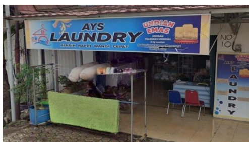
Gambar 4 Kompetitor 2