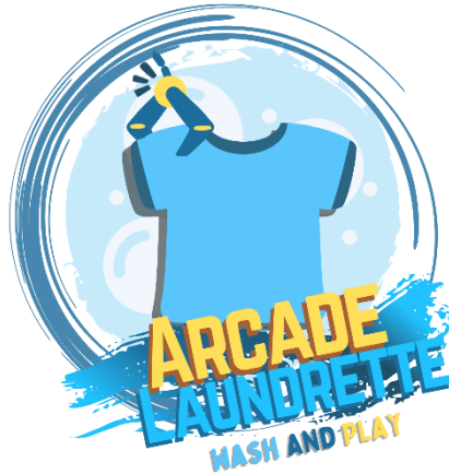
GAMBAR 1 LOGO ARCADE LAUNDRETTE