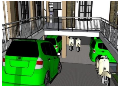
Gambar 1.4 Basement Akasha Kost