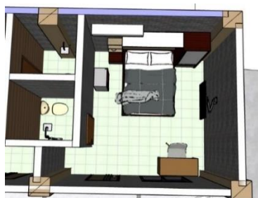
Gambar 1.11 Superior Room Akasha Kost