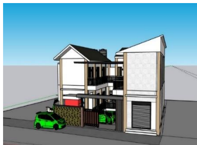
Gambar 1.3 Bangunan Akasha Kost