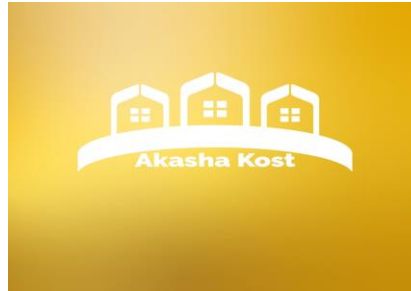
Gambar 1.1 Logo Akasha Kost