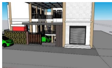
Gambar 1.9 Penyewaan tempat usaha