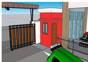
Gambar 1.6 Pos Keamanan Akasha Kost