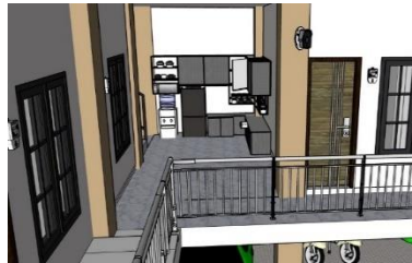
Gambar 1.5 Dapur Umum Akasha Kost