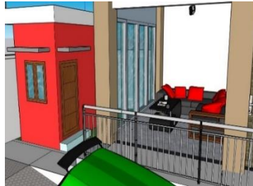
Gambar 1.7 Ruang tamu Akasha Kost