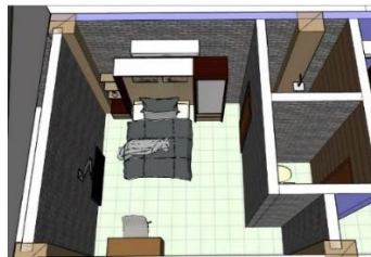
Gambar 1.10 Standard Room Akasha Kost