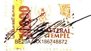
KEVIN GUSTAV LORENZO

Bandung, 2 Januari 2023 Yang membuat pernyataan,