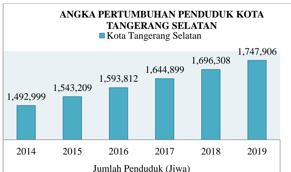
TABEL 1. 1 PERTUMBUHAN PENDUDUK DI KOTA TANGERANG SELATAN