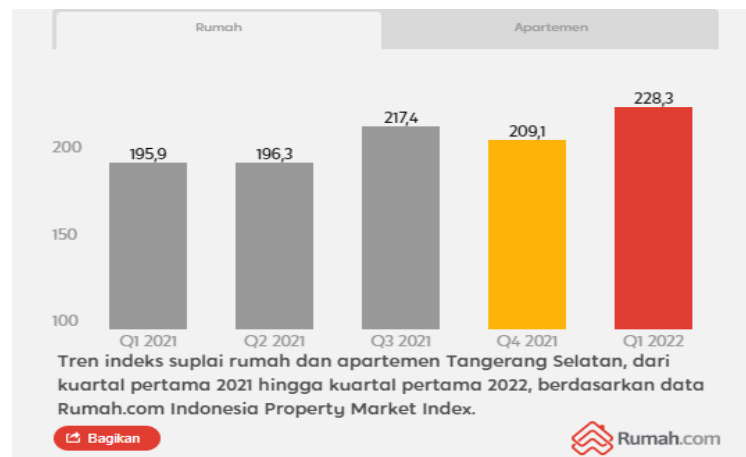
GAMBAR 1. 1 TREND INDEKS SUPLAI DI KOTA TANGERANG SELATAN

Apartment di Tangerang Selatan yang semakin meningkat di tahun sebelumnya di 2022.