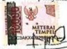
Dini Fildza Ikramina