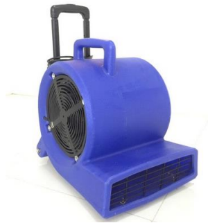
Gambar 1.8 Blower Mechine