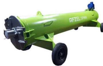
Gambar 1.6 Mesin Carpet Spinner

Laundry Carpet Eco Clean menyediakan pelayanan onplan laundry karpet. Pelayanan onplan ini dapat dilakukan dengan menggunakan mesin vacuum cleaner extractor dan blower sebagai pengeringnya. Pada pelayanan pencucian karpet secara onsite , pencucian karpet dilakukan menggunakan mesin khusus yaitu ( shampooing carpet machine ) dengan menggunakan soft brush , dan mesin pengering karpet yang digunakan yaitu carpet spinner yang mampu mengurangi kadar air sebesar 90%. Berikut gambar mesin: