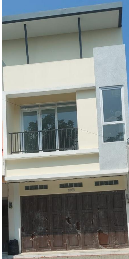
Gambar 1.5 Ruko Laundry Carpet Eco Clean