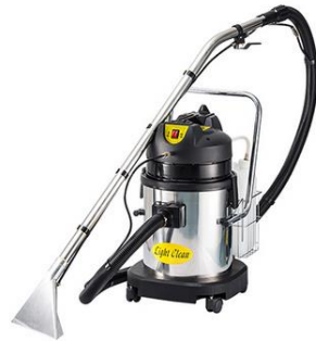
Gambar 1.9 Vacuum Cleaner Extractor