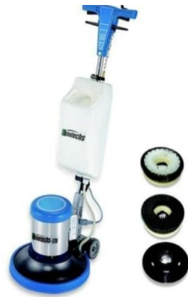
Gambar 1.7 Shampooing Carpet Machine