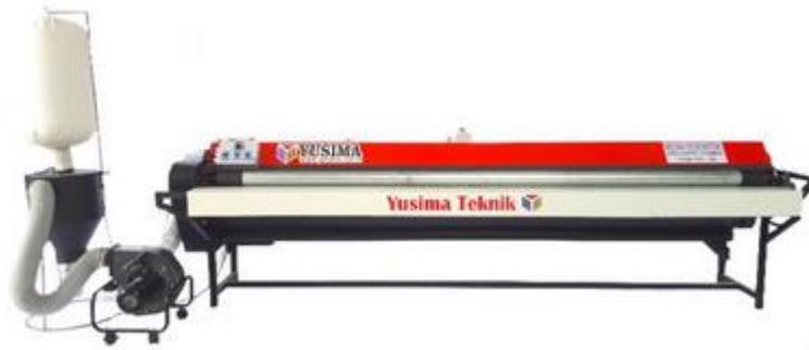
Gambar 1.10 Rug Duster Mechine