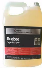
Gambar 1.11 Chemical