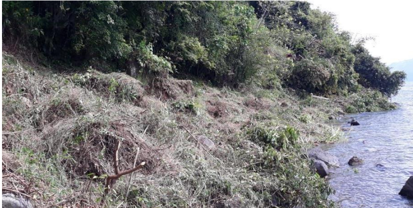
Gambar 1. 1 Lokasi lahan ElCielo Toba Glamping

glamping dan jarak dari setiap tenda nya. Berikut gambar lahan yang akan menjadi lokasi ElCielo Toba Glamping.