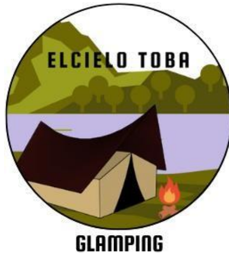
Gambar 1. 2 Logo ElCielo Toba Glamping