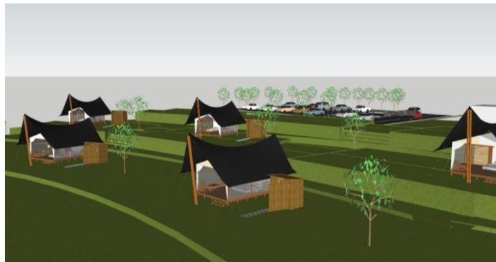
Gambar 1. 4 Layout Keseluruhan Glamping

Tenda Glamping yang akan disediakan merupakan tenda Safari ( Safari tent ) yang berbentuk menyerupai Rumah adat batak yang memiliki ukuran berbeda-beda sesuai dengan tipe kamar serta kapasitas tamu yang berbeda juga di setiap tenda nya.