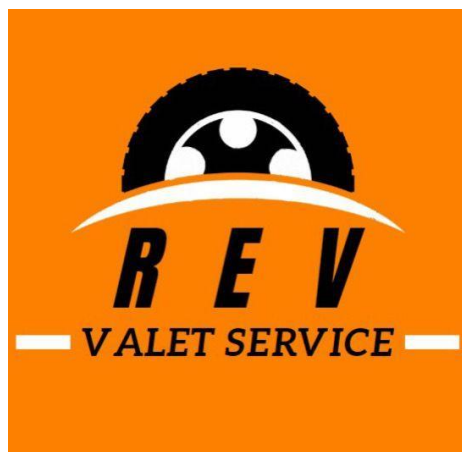
GAMBAR 1.1 DESIGN LOGO REV VALET