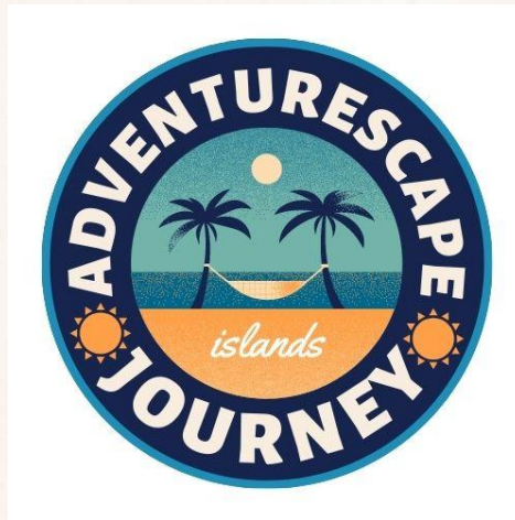
Gambar 1 – Logo Adventurescape Journey

Nama Adventurescape Journey yang merupakan perjalanan petualangan seseorang untuk melarikan diri dari aktivitas penat yang biasa dilakukan sehari-hari. Adventurescape Journey sendiri dapat diartikan sebagai rangkaian kegiatan berwisata yang berbentuk paket perjalanan wisata. Adventurescape Journey ini akan dibentuk menjadi badan usaha di bidang pariwisata yang memfokuskan pada pelayanan jasa seperti menjaga, melayani dan memberikan pengarahannya terkait kegiatan berwisata yang dilakukan.