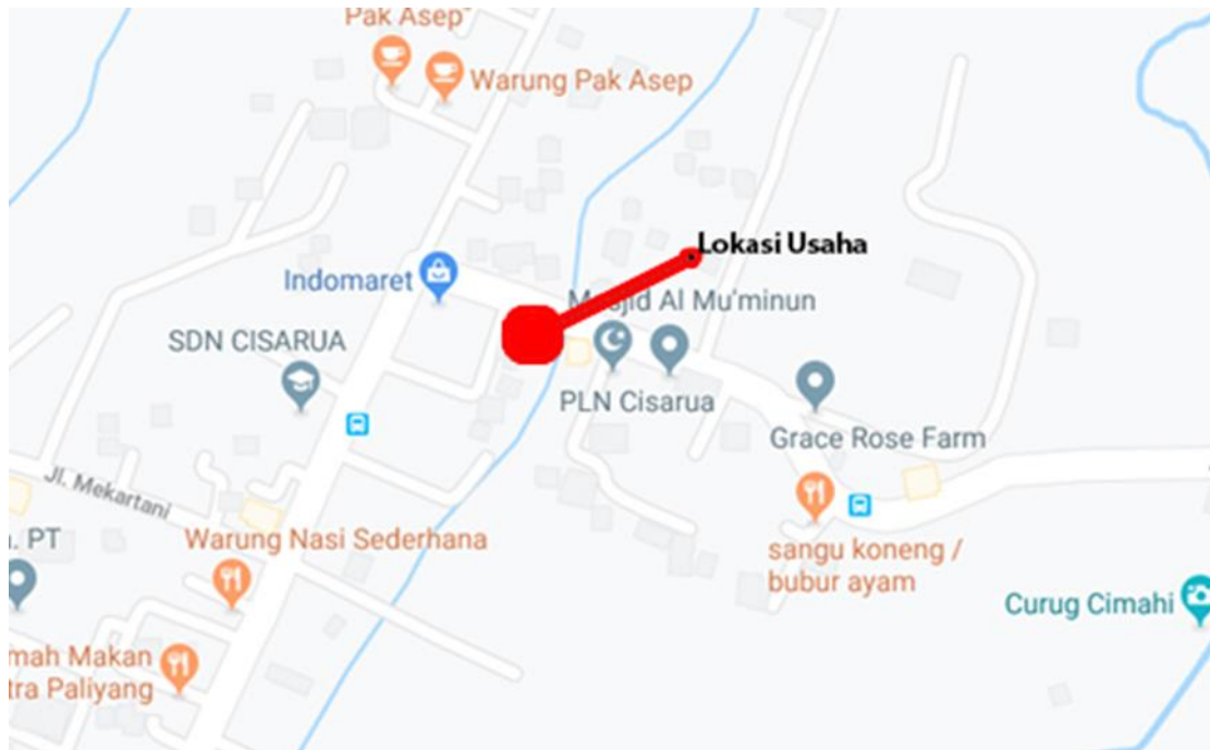
Gambar 1 Lokasi Usaha