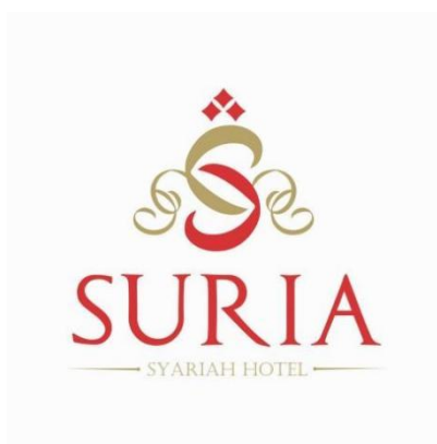
Gambar 1. 1 Logo Suria City Hotel