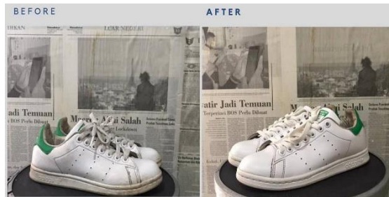
Gambar 1. 5 Fast Cleaning