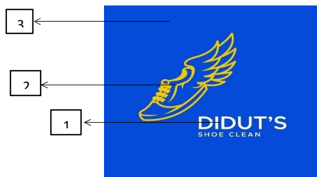
Gambar 1. 2 Logo Didut’s Shoe Clean

Tidak hanya merek yang cukup penting dari setiap usaha. Maka dari itu bila ingin lebih dikenal penulis akan sampaikan ‘Logo’ diharapkan dapat mengenalkan suatu usaha laundry sepatu sehingga para pelanggan dapat mengenali identitas laundry sepatu. Penjelasan dan makna yang terdapat di pada logo yaitu dapat diartikan sebagai berikut :