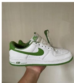
Gambar 1. 4 Cleaning Deep