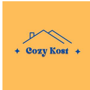
Gambar 1.1 Logo Bisnis Cozy Kost