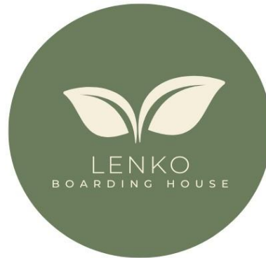
GAMBAR 1. 1 Logo Perusahaan