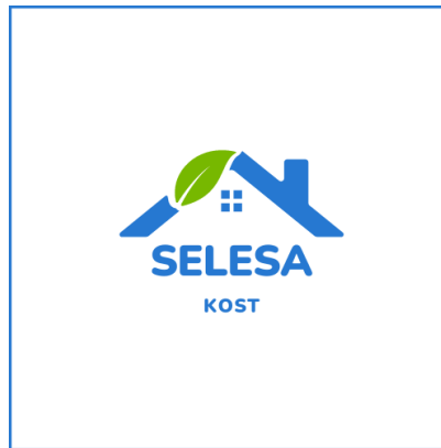
Logo Selesa kost