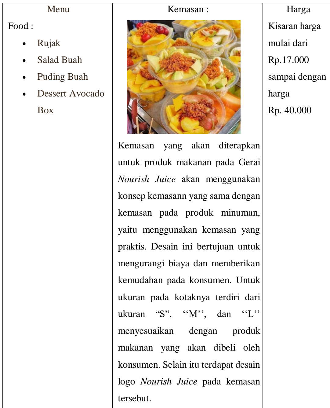
LANJUTAN TABEL 3 SPESIFIK PRODUK DAN JASA