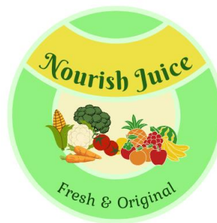
GAMBAR 1 LOGO USAHA

Gerei jus sehat yang akan dibuka oleh penulis dinamakan Gerei Nourish Juice . Penentuan nama dan desain logo perusahaan merupakan faktor penting yang harus diperhatikan untuk membangun identitas yang kuat bagi perusahaan atau produk tersebut Marlina, 2019.