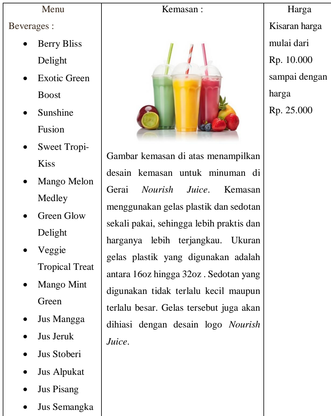
TABEL 3 SPESIFIKASI PRODUK DAN JASA