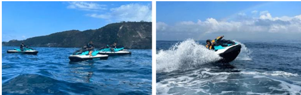
Gambar 4. Aktivitas jet ski di Fun Day Nusa Dua

Fun Day Nusa Dua merupakan salah satu penyedia aktivitas petualangan alam menggunakan jet ski di Bali. Beberapa pemain yang menyediakan aktivitas serupa yaitu Jetski Safari Bali Wibisana, Seadoo Safari Lembongan, Bali Amarta Watersport, Jetski Bali Wibisana dan Jetski Prestige Bali. Perusahaan-perusahaan tersebut menyediakan pengalaman bermain jet ski dengan konsep petualangan ke pulau maupun pantai yang indah. Jet ski dan perlengkapan yang digunakan biasanya memiliki standar yang tinggi dengan adanya guide profesional yang memandu aktivitas.