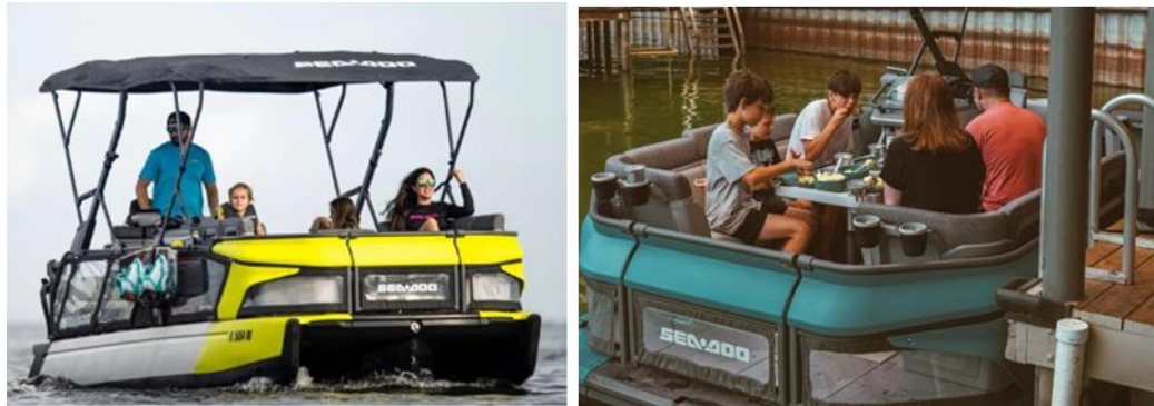
Gambar 3. Aktivitas Seadoo Switch

mendapatkan penghargaan dari Silver Edison Innovation, iF Design Award dan Red Dot Design Award. Brand Seadoo dipersepsikan sebagai merek terkemuka untuk kesenangan, kelincahan, handling dan transportasi yang personal bagi setiap customernya.