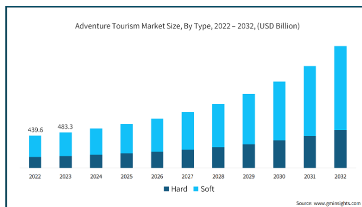
Gambar 1. Adventure tourism market size

Pertumbuhan pada sektor adventure tourism mengakibatkan kenaikan wisatawan yang mencari pengalaman otentik yang menonjolkan nilai-nilai alam dan budaya (Janowski et al., 2021). Meningkatnya investasi di bidang adventure tourism membuat adanya perkembangan pada infrastruktur, akomodasi, fasilitas rekreasi petualangan.