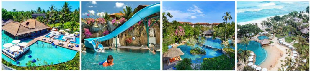
Gambar 2. Family-friendly resort di Nusa Dua