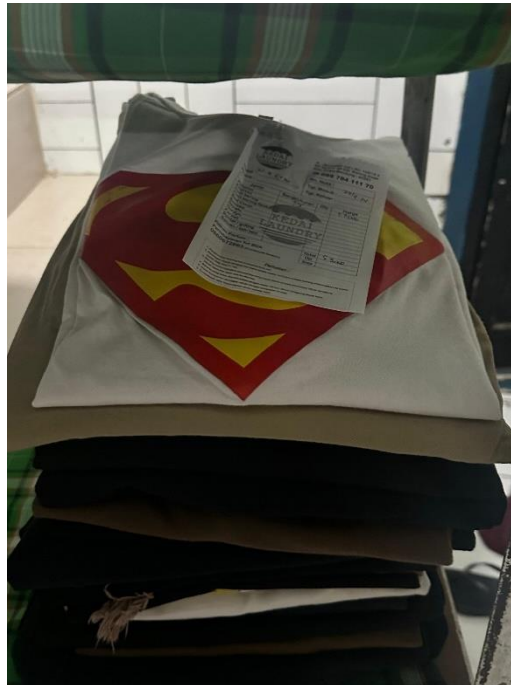
Gambar 1.7 Produk Layanan Setrika

Layanan menyetrika pakaian pelanggan kemudian di kemas, proses pengerjaan selesai dalam satu hari, layanan ini menerima pakaian satuan dan kiloan.