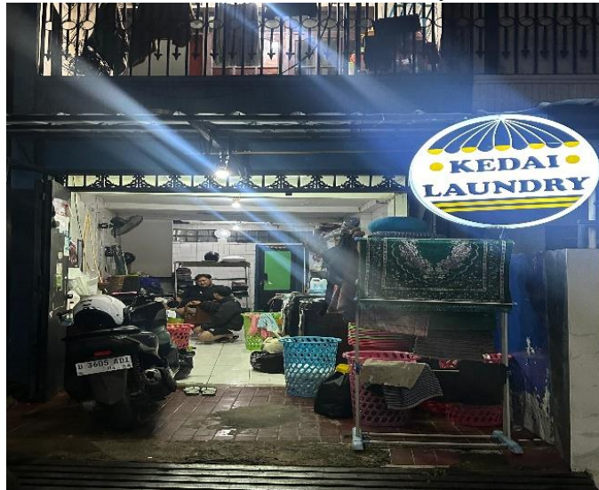
Gambar 1.2 Kedai Laundry

Pendapatan Kedai Laundry berasal dari usaha ini sendiri dan bekerja sama dengan kost yaitu White House. Sedangkan pengeluaran yang dimaksud adalah pengeluaran yang berasal dari pembayaran upah karyawan, listrik, gas, dan perlengkapan laundry lainnya