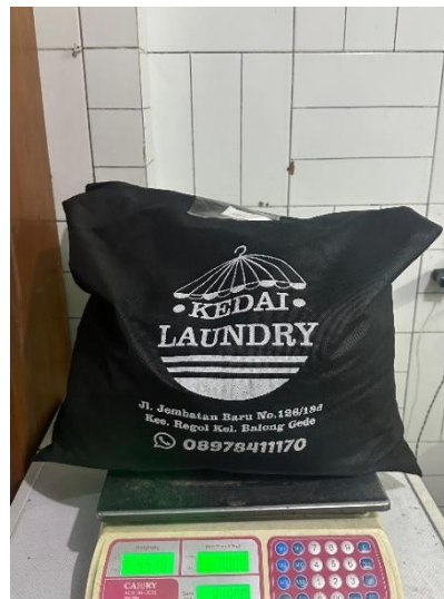
Gambar 1.6 Produk Laundry Kiloan

Pada layanan laundry kiloan, Pelanggan bisa mengambil lagi pakaian dalam rentang 1-2 hari.