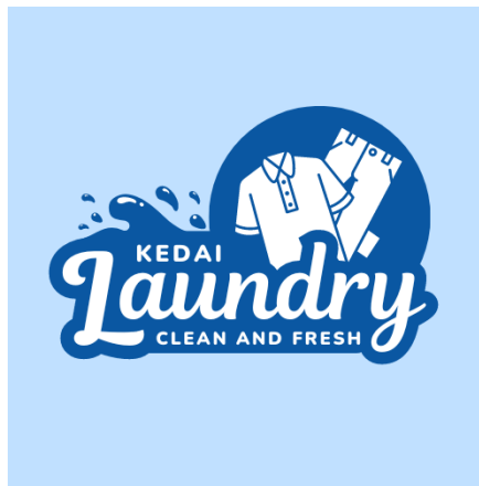
Gambar 1.4 Logo Kedai Laundry

bisnis dapat memperkuat citra bisnis kita di mata konsumen dan mendapatkan kepercayaan calon pelanggan, Kedai Laundry tersebut mempunyai logo yang bermakna sebagai berikut