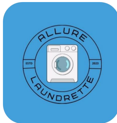
Gambar 2, Logo Allure Laundrette Station

Berdasarkan bisnis yang diambil “Allure Laundrette Station” Allure sendiri berasal dari Bahasa Inggris yang berarti “ Daya Tarik ” sekaligus menjadi doa dari pemilik bisnis agar usaha yang didirikan dan akan dijalankan dapat menarik minat pelanggan dengan fasilitas dan pelayanan yang telah diberikan