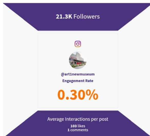
GAMBAR 3 ENGAGEMENT RATE INSTAGRAM @ART1NEWMUSEUM

Art:1 Museum and Art Space adalah salah satu museum yang menggunakan Pemasaran Digital melalui media sosial menggunakan platform Instagram ( @art1newmuseum ) namun dirasa belum optimal dikarenakan Engagement rate Instagram yang dimiliki Art:1 New Museum and Art Space masih jauh dibawah standard . Berikut ini gambaran dari engagement rate pada akun Instagram Art:1 New Museum and Art Space (@art1newmuseum)