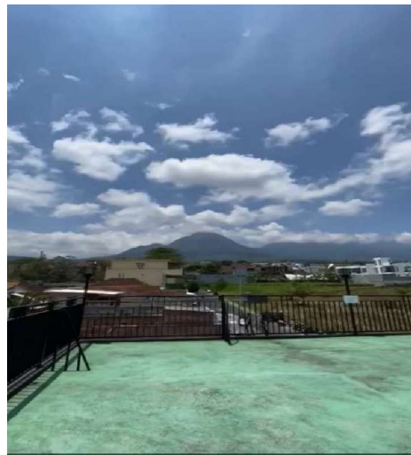
Gambar 1. 8 Rooftop Area