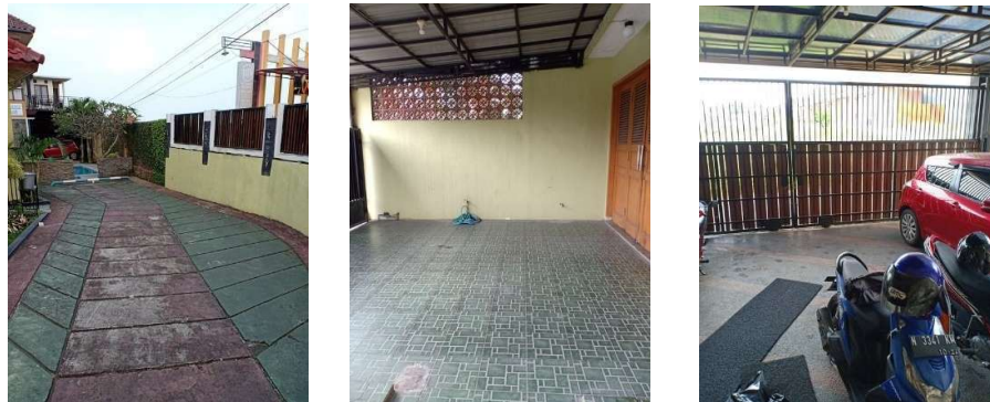
Gambar 1. 15 Area Parkir