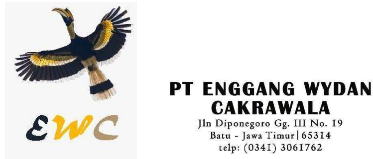
Gambar 1. 16 Logo PT Enggang Wydan Cakrawala