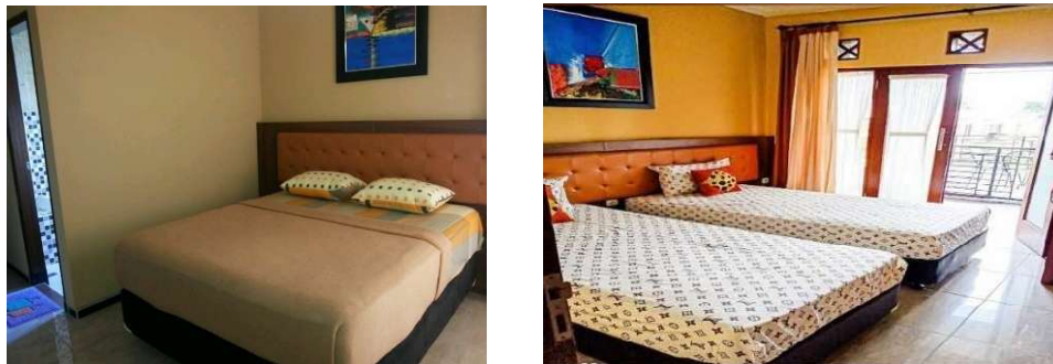
Gambar 1. 11 Ruang Tidur