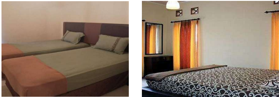
Gambar 1. 5 Ruang Tidur Villa ATTAKA Tunu