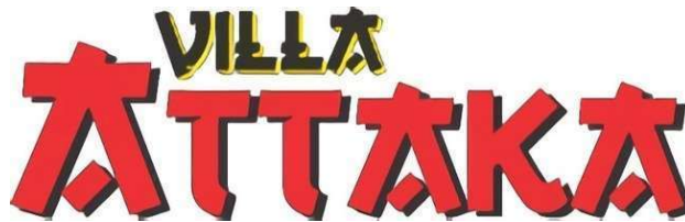
Gambar 1. 1 Logo Villa ATTAKA Batu

Maka dari itu, logo memiliki peran yang krusial dalam branding sehingga bisnis memiliki identitas yang kuat serta dapat mengingat brand tersebut dibandingkan brand yang lain.