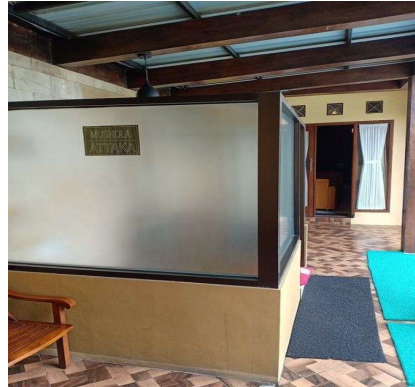
Gambar 1. 14 Musholla