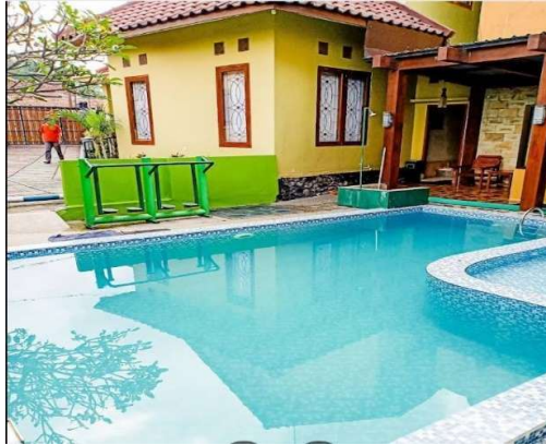
Gambar 1. 13 Kolam Renang