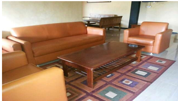
Gambar 1. 10 Ruang Tamu Villa ATTAKA Nubi