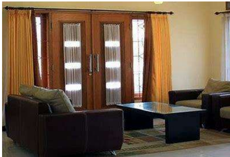
Gambar 1. 4 Ruang Tamu Villa ATTAKA Tunu