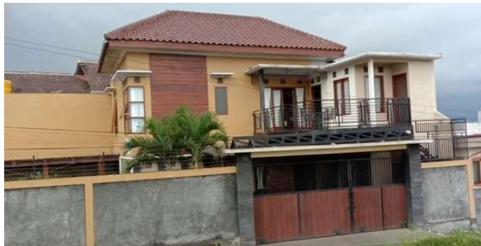
Gambar 1. 9 Gedung Villa ATTAKA Nubi