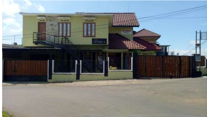
Gambar 1. 3 Gedung Villa ATTAKA Tunu