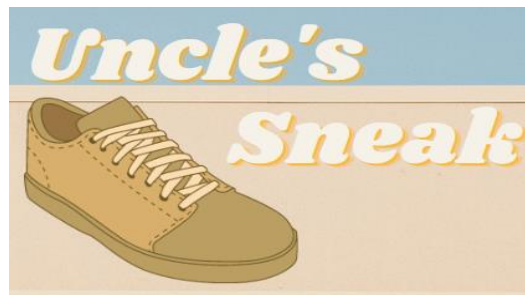
Logo Uncle's Sneak

Berikut adalah arti dan maksud logo dari Uncle's Sneak :