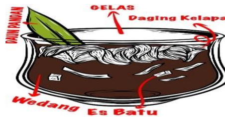
Gambar 1. 3 Wedang Kobbhu