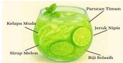
Gambar 2 Sketsa Es Kuwut Timun