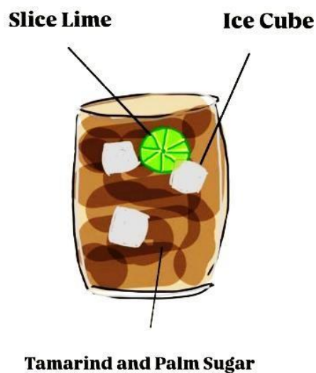
Gambar 3 Sketsa Es Gula Asem

Sebagai pelengkap disajikan Tamarind dan Palm Sugar sebagai based dari minuman itu sendiri juga Slice Lime untuk melengkapi segarnya minuman ini.