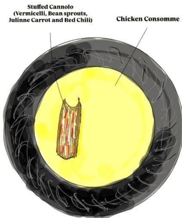
Gambar 1 Sketsa Soto Kletuk

Ayam kampung sebagai bahan utama digunakan sebagai kaldu dengan Teknik consommé , dilengkapi dengan Stuffed Cannolo untuk base terbuat dari singkong dengan isi Vermicelli , Bean sprouts , Julienne Red Chili .