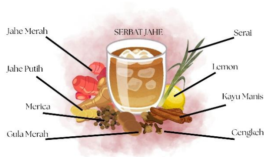
GAMBAR 3 SKETSA SERBAT JAHE