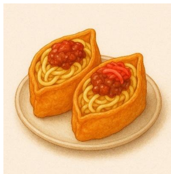
Gambar 1.1 Sketsa Mie Tahu

Inari Tofu dengan isian mie kuning dan corned beef yang gurih, disajikan bersama saus kacang yang kaya rasa. Hidangan ini dipadukan dengan kelembutan Cherry Tomato Foam yang memberikan sensasi segar, serta Lettuce Gel yang menghadirkan sentuhan hijau nan seimbang untuk melengkapi keseluruhan cita rasa.