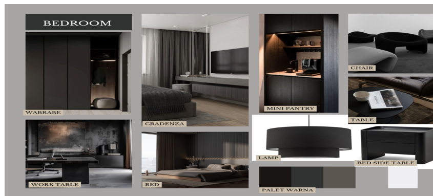
Gambar 1. 2 Mood Board