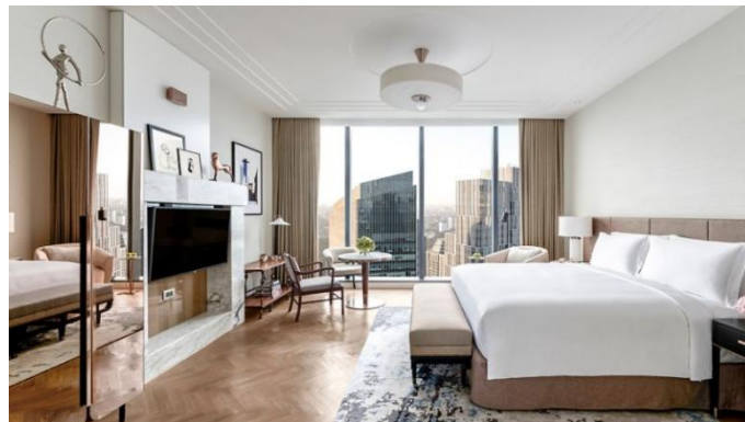
Gambar 1. 1 Tema