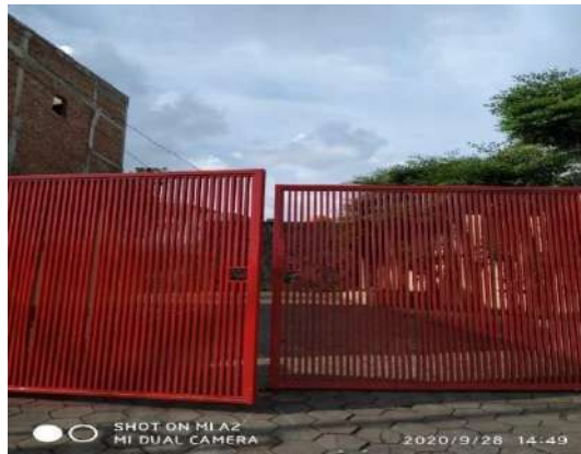
Gambar 1. 5 Tempat Parkir area luar