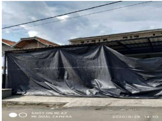
Gambar 1. 2 Tampak depan yang akan di jadikan tempat usaha