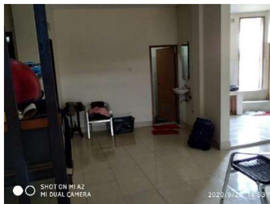
Gambar 1. 4 Tampak Dalam Tempat Usaha (2)