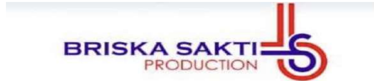
Gambar 1. 1

Berikut adalah logo dari Briska Sakti Production: