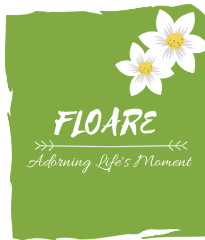
Gambar 1.2 Logo Floare apps and shop

memenuhi kebutuhan suatu Hotel. Florist yang akan dibuat oleh penulis ini bernama “Floare Apps and shop”. Floare sendiri berasal dari bahasa Rumania yang berarti Bunga. Usaha ini adalah wujud dari keinginan penulis membantu masyarakat bandung mendapatkan rangkaian bunga yang mereka butuhkan dengan cara yang lebih efektif dan efisien. Dilihat dari pelayanan yang diberikan oleh floare target pasar dalam usaha ini adalah konsumen yang berada di kota bandung.