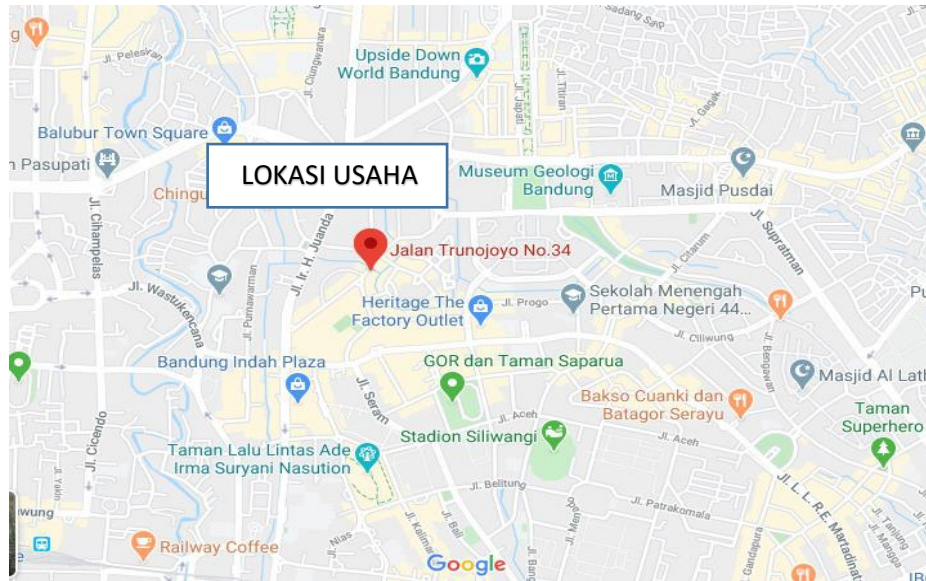
Gambar 1.4 Lokasi Usaha