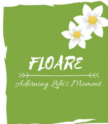
Gambar 1.3 Logo Floare App and Shop

Logo yang penulis buat untuk floare apps diambil dari beberapa unsur dan makna sebagai berikut :