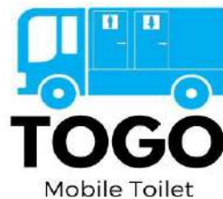
Gambar 2: Logo Usaha