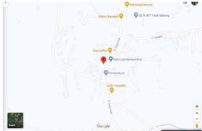
Peta Lokasi Usaha

B. Lokasi : Jl. Hang Tuah, Ekang Anculai, Tlk. Sebung, Kabupaten Bintan, Kepulauan Riau 29151