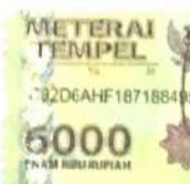
LUCKY DWI GUMILAR