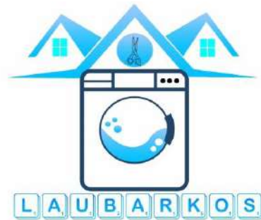
Gambar 1.1 Logo LauBarKos