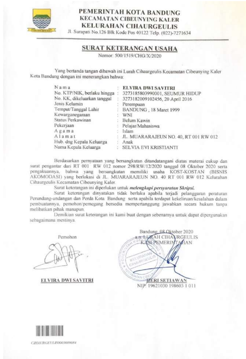
Gambar 1.3 Surat Keterangan Usaha Milik Penulis