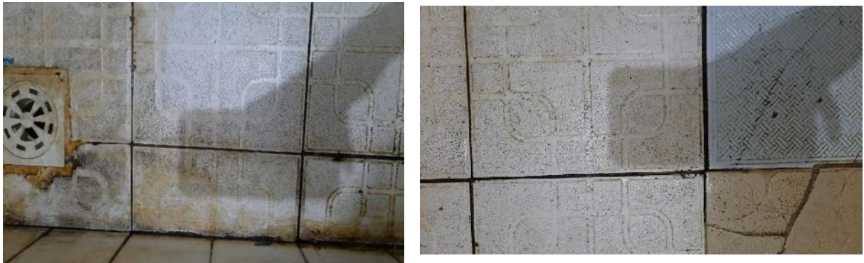
GAMBAR 2 NODA KERAK KAMAR MANDI

Masalah noda yang sering kita jumpai dalam lantai kamar mandi yang menggunakan keramik adalah noda kerak dan penebalan lapisan lantai. Yang terjadi akibat dari seringnya lantai keramik tersebut terkena chemical dari residu sabun mandi atau bahkan dari chemical yang digunakan untuk membersihkan lantai tersebut. Sisa dari residu yang menempel pada lantai tersebut akan menimbulkan kesan yang kurang bersih atau sangat kotor. Diperlukan proses pembersihan serta pemeliharaan agar tetap bersih juga tidak kusam. Noda tersebut harus dibersihkan secara rutin untuk menghindari munculnya noda kerak pada lantai.