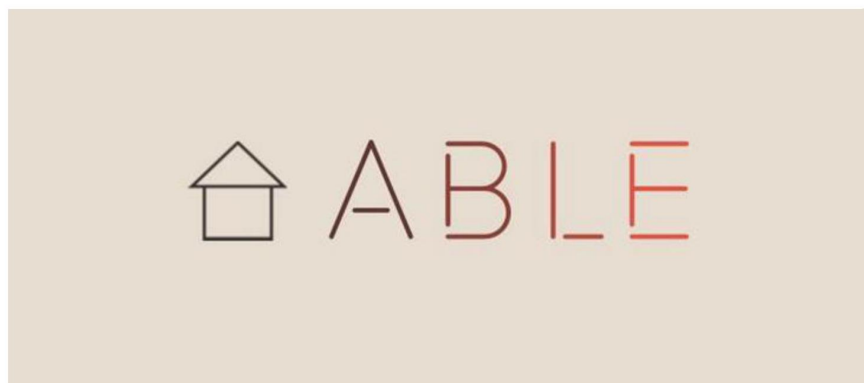
Gambar 1. 2 Logo Rumah Able

Untuk membuat dan mendirikan sebuah bisnis penting untuk memilih dan membuat sebuah nama dan logo yang menarik dan juga terkesan untuk gampang mebuat orang – orang mengingatnya serta memiliki filosofi atau makna tersendiri. Pembuatan nama dan logo itu sangatlah penting bertujuan untuk proses penamaan atau strategy marketing , logo menjadi bentuk ciri khas dan citra dalam identity pada usaha. Pengertian branding menurut Bilson Simora adalah nama, tanda, istilah, simbol, design atau kombinasi untuk mengidentifikasi suatu bisnis.