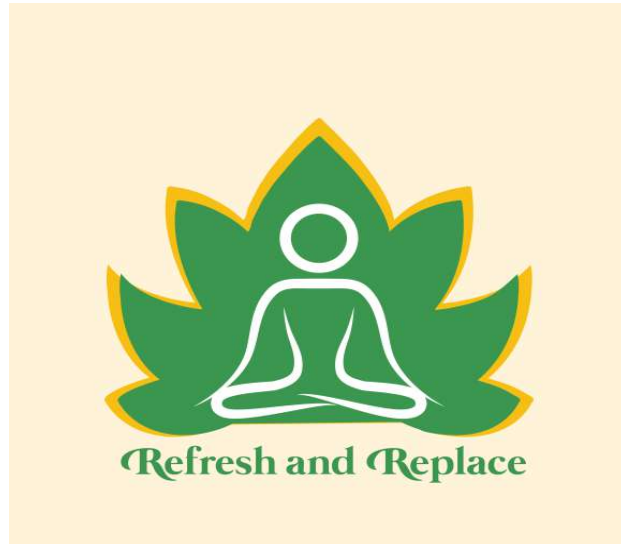
Gambar 1.2 Logo Perusahaan

Logo Refresh and Replace mempunyai arti simbol kehidupan, kesuburan, keamanan dan lingkungan. Warna hijau memberikan kesan damai, ketenangan secara emosional, sehat dan subur. Dan juga warna hijau mengingatkan kita dengan alam. Selain itu kuning juga menggambarkan kegembiraan dan harapan. Seperti halnya sinar matahari yang membuat hari kita untuk selalu bersemangat. Dan gambar menyerupai daun ini memiliki arti yaitu menyatu dengan alam.