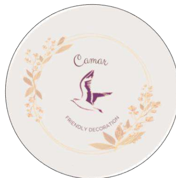
Gambar 1. 2 Logo Perusahaan